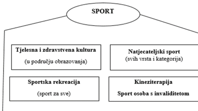
Slika 1. Područja sporta