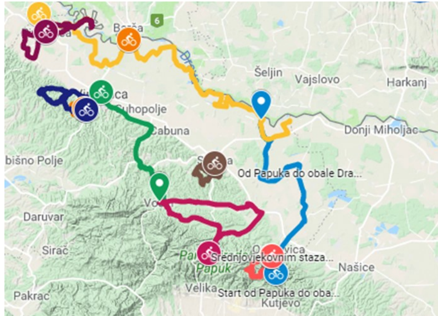
Slika 2. Karta biciklističkih staza na Papuku