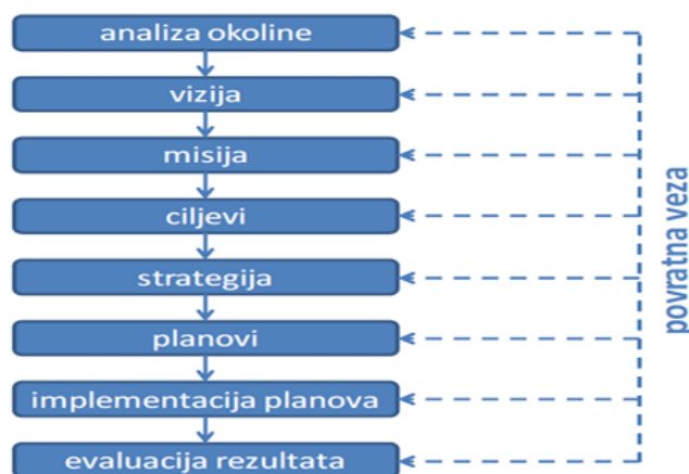
Silke 2. Faze procesa planiranja

Samo planiranje sastoji se od nekoliko faza, a sve započinje s analizom okoline od koje se mora dobiti povratna informacija kako bi se mogao poduzeti jedan od sljedećih koraka. Na Slici 2. prikazane su faze procesa planiranja.