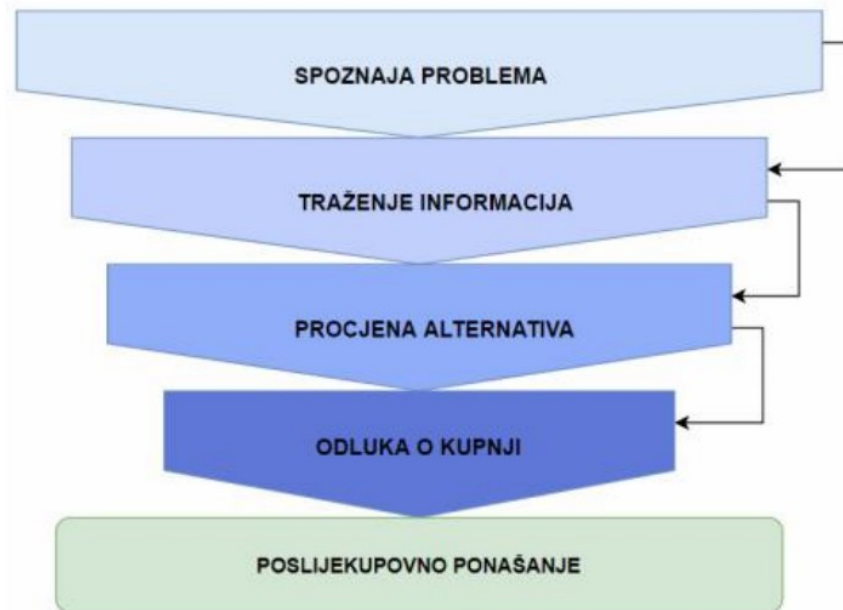
Slika 3. Faze donošenja odluke o kupovini

Izvor: Prema: Kotler, P., Keller, K. L., Martinović, M. (2014:166.). Upravljanje marketingom, 14. izdanje Mate d.o.o.