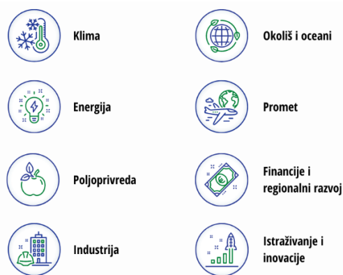
Slika 2. Područja djelovanja Europskog zelenog plana

Europski zeleni plan odnosi se na čak 8 područja djelovanja (prikazano na Slici 2.).