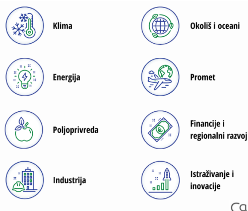
Slika 2. Područja djelovanja Europskog zelenog plana