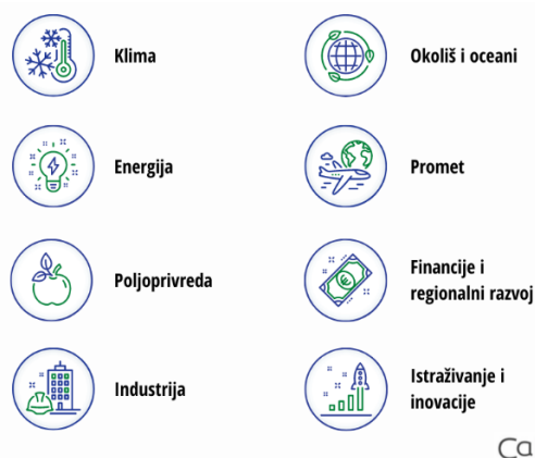
Slika 2. Područja djelovanja Europskog zelenog plana