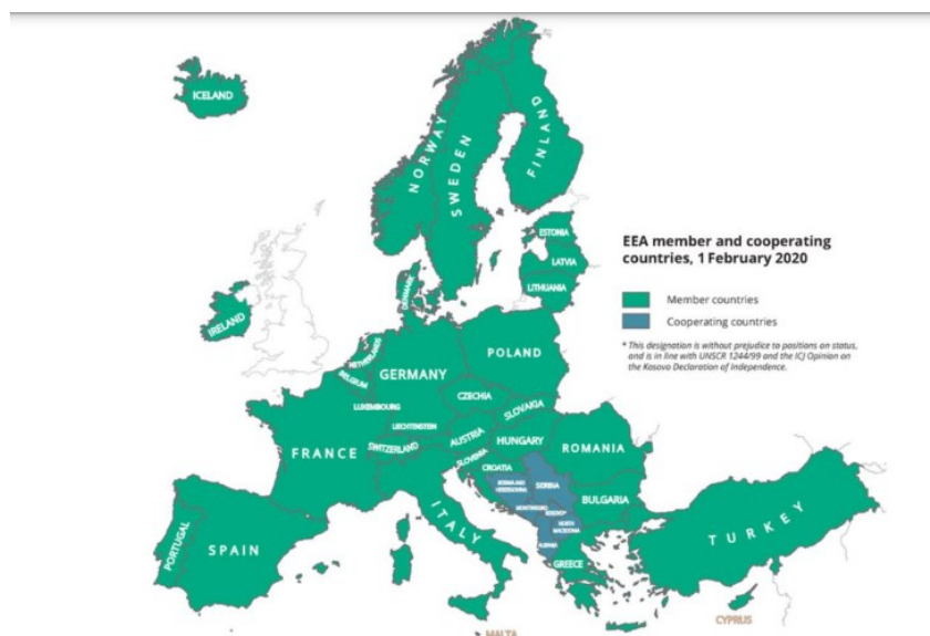
Slika 1. Zemlje članice i zemlje sudionice EEA