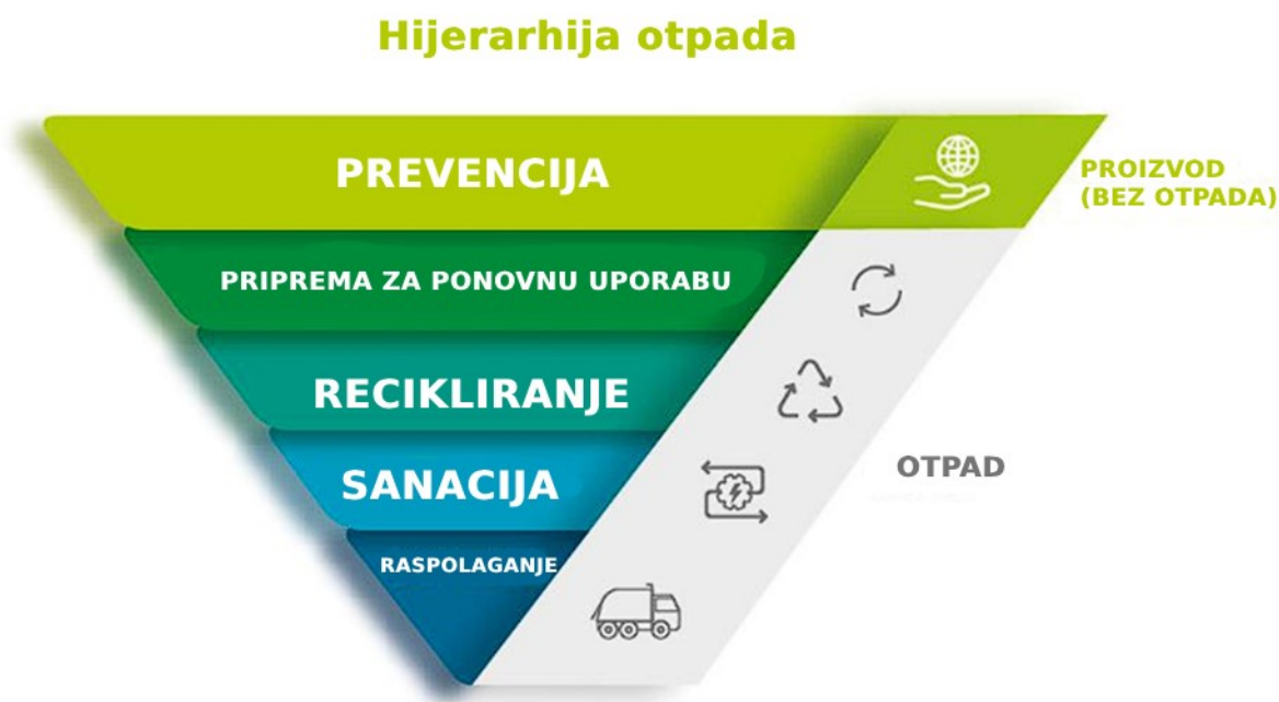
Slika 4. Hijerarhija otpada

Gospodarenje otpadom na ekološki prihvatljiv način i korištenje sekundarnih materijala koji sadrže ključni su elementi politike zaštite okoliša EU-a. Cilj politike EU-a o otpadu je doprinijeti kružnom gospodarstvu povećanjem izdvajanja visokokvalitetnih resursa iz otpada koliko god je moguće. Europski zeleni dogovor ima za cilj poticati moderni, resursno učinkovit i konkurentan rast gospodarstva. Kako bi se postigla ova tranzicija, nekoliko zakona EU-a o otpadu bit će revidirano. Okvirna direktiva o otpadu predstavlja pravni okvir za obradu i upravljanje otpadom unutar EU-a, a uključuje "hijerarhiju otpada" koja određuje redoslijed prioriteta u gospodarenju otpadom. Glavni cilj ove politike je zaštita okoliša i ljudskog zdravlja, te poticanje prelaska EU-a na kružno gospodarstvo. U postizanju ovih ciljeva ključne su točke: Poboljšanje gospodarenja otpadom, poticanje inovacija u recikliranju, te ograničavanje odlaganja otpada. 22