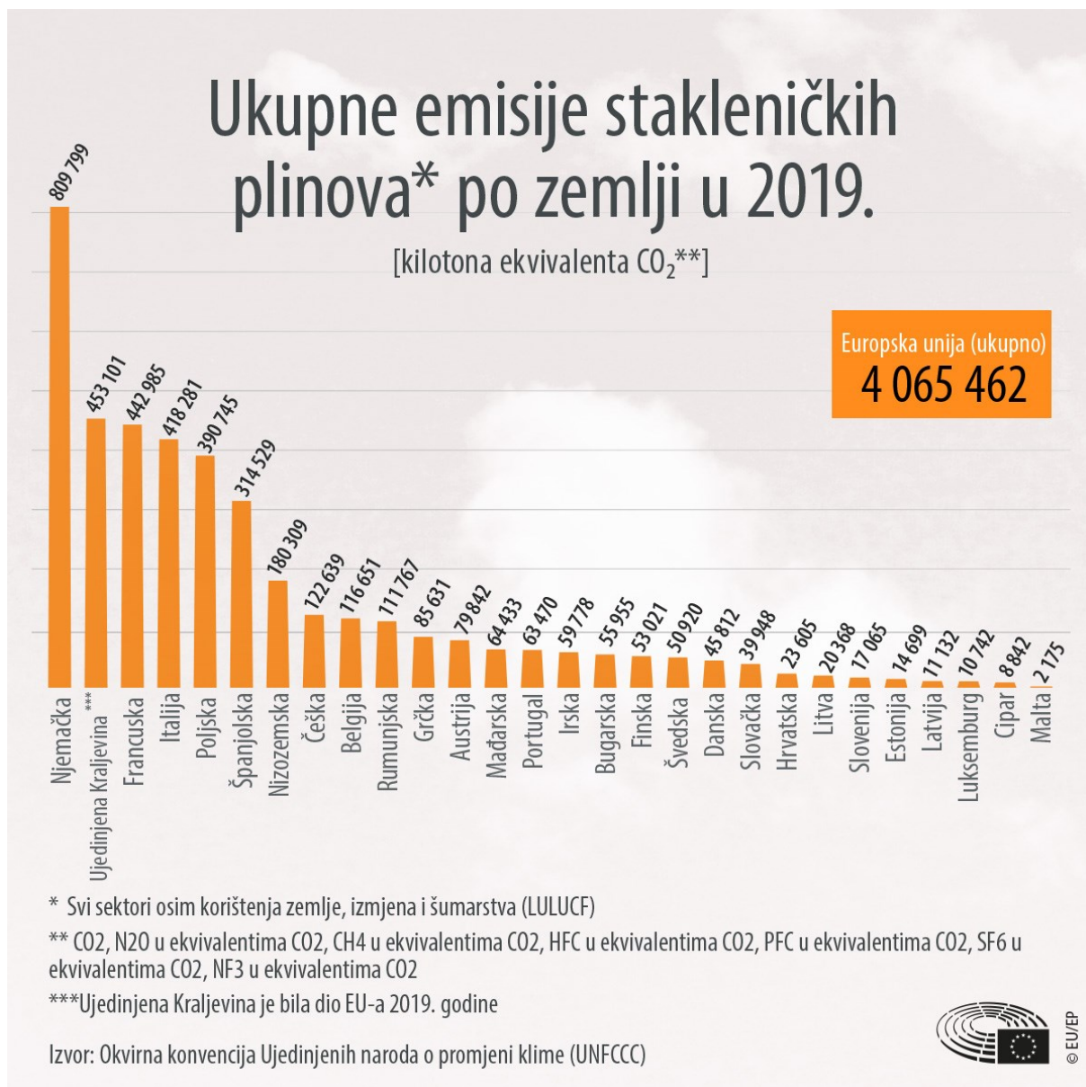
Slika 1. Usporedba ukupnih emisija stakleničkih plinova svih članica EU u 2019. godini

daljnju predanost RH u borbi protiv klimatskih promjena te smanjenju štetnih emisija stakleničkih plinova 71 .