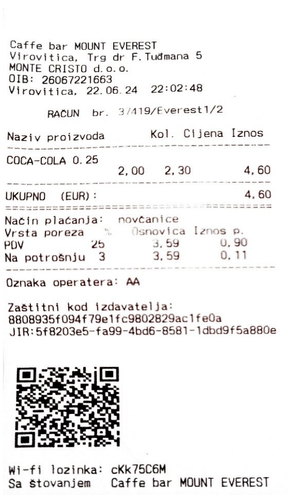
Slika 1. Račun