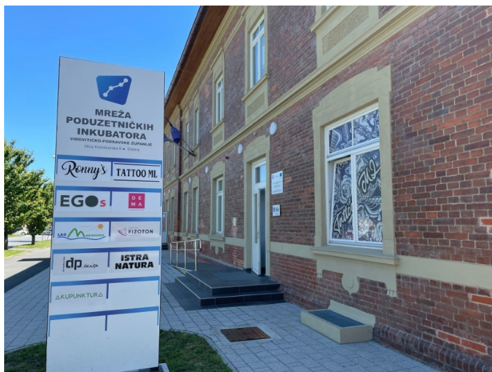
Slika 3. Poduzetnički inkubator u Slatini