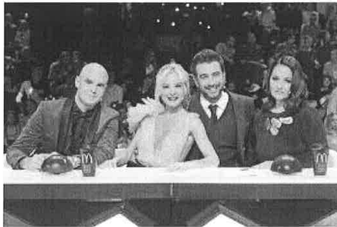
Slika 2. Žiri Supertalent Hrvatska i oglašavanje Mc Donaldsa