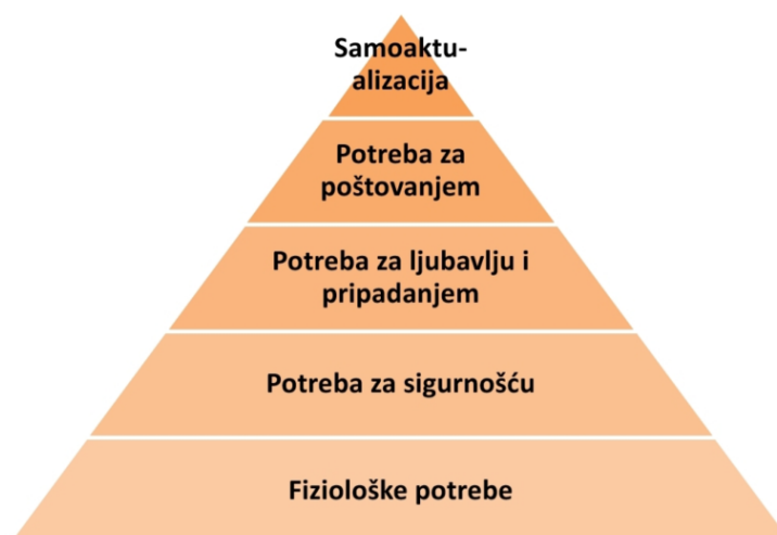
Slika 1. Maslowljeva piramida potreba