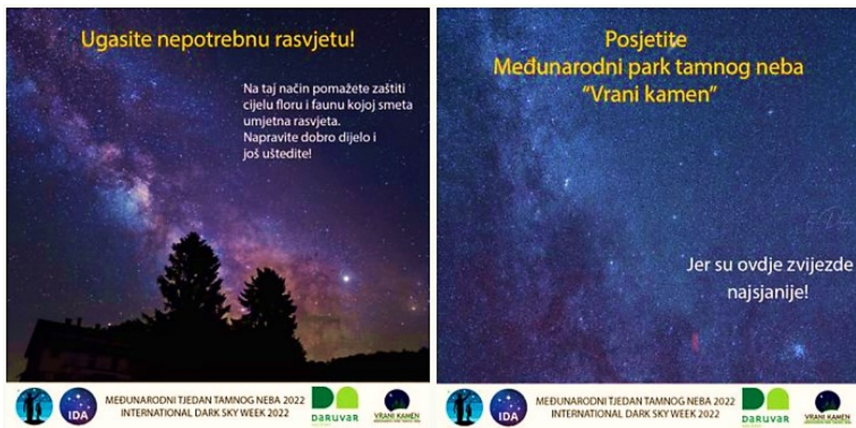
Slika 3 Poučni materijali MPTN Vrani kamen