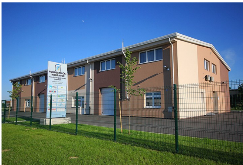
Slika 2. Poduzetnički inkubator u Virovitici

Izvor: Hrvatska udruga poslodavaca, https://www.hup.hr/novi-clan-hup-a-poduzetnicki-inkubator-viroviticke-podravskje-zupanije , (3.7.2024.)