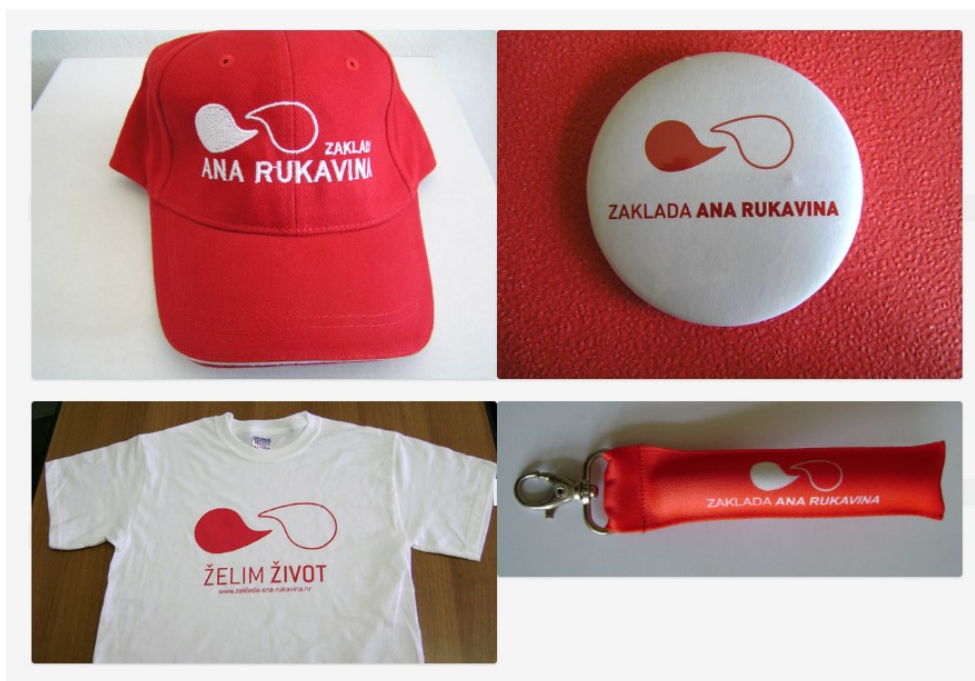
Slika 2. Promotivni materijali zaklade