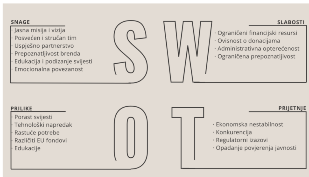
Slika 3. SWOT analiza Zaklade