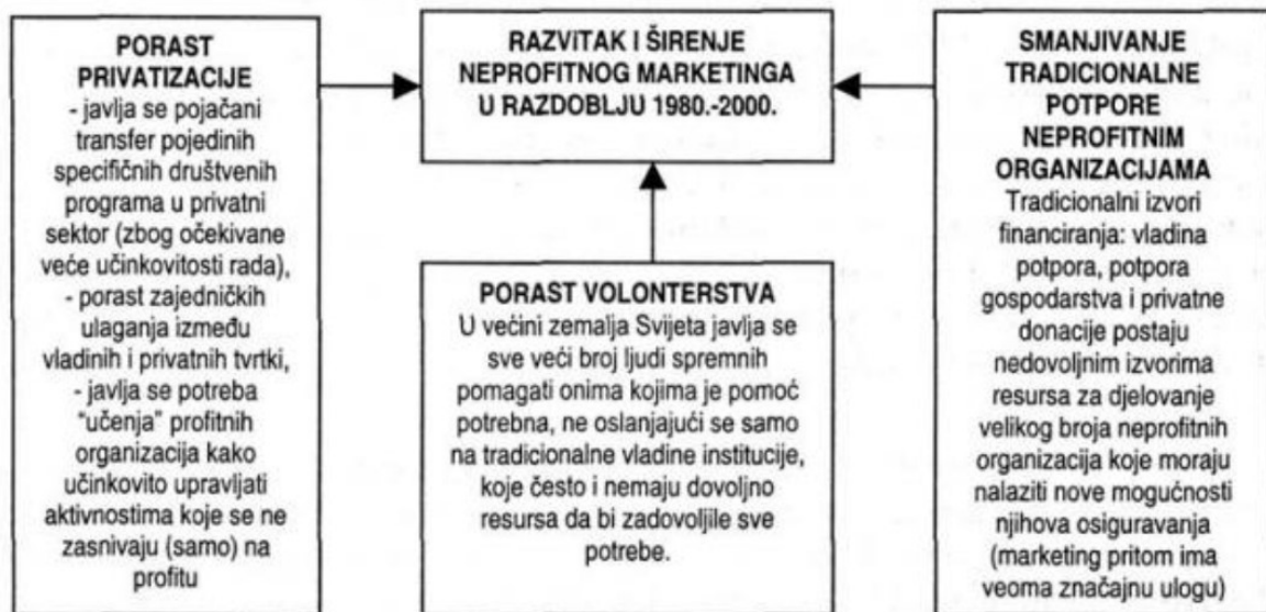
Slika 1. Razlozi širenja i razvijanja neprofitnog marketinga