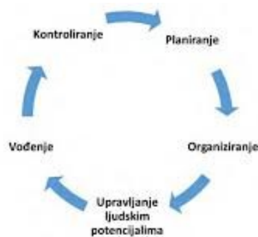
Slika 2. Funkcije menadžmenta