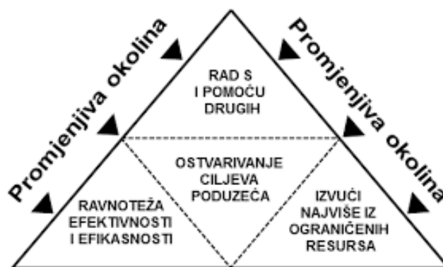
Slika 1. Ključni aspekti menadžerskog procesa