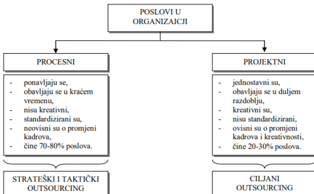
Slika 2. Vrste outsourcinga