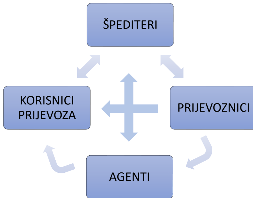
Slika 1. Interakcija subjekata tržišta prijevoznih kapaciteta