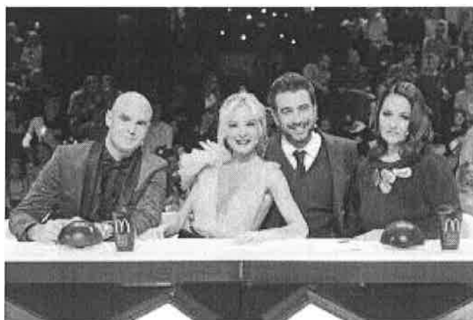
Slika 2. Žiri Supertalent Hrvatska i oglašavanje Mc Donaldsa