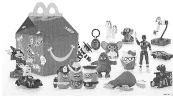
Slika 6. Mc Donalds Happy meal ponuda igračaka