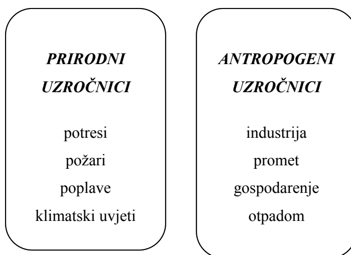
Slika 2. Glavni uzročnici degradacije okoliša