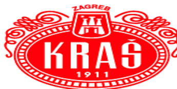
Slika 4. Logotip poduzeća Kraš d.d.