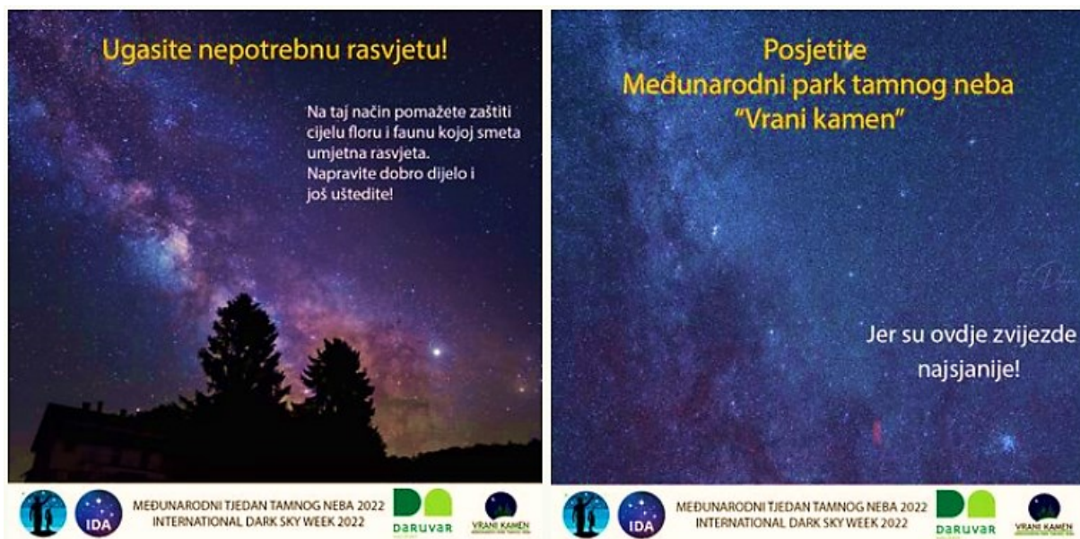
Slika 3 Poučni materijali MPTN Vrani kamen