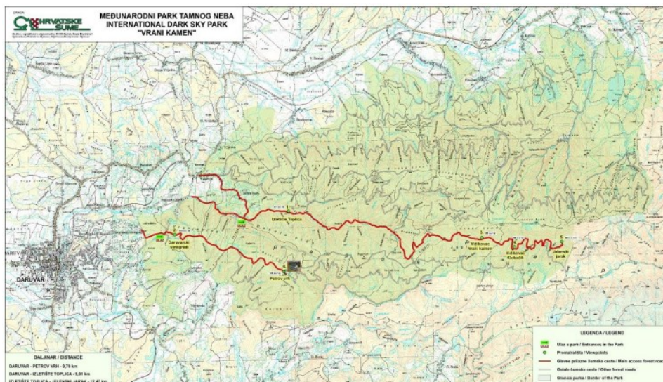
Slika 2 Karta MPTN Vrani kamen za astronome