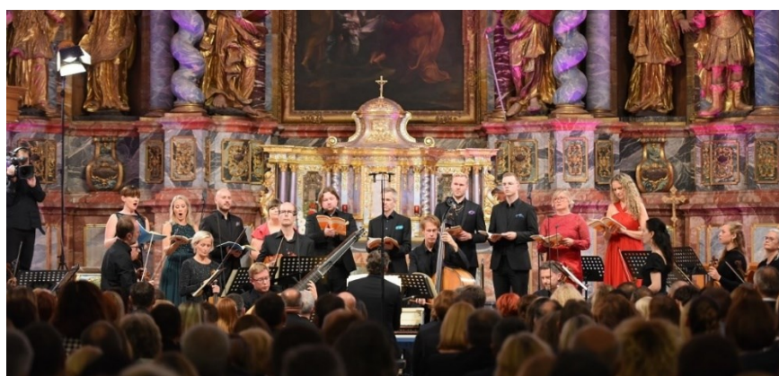
Slika 9. Varaždinske barokne večeri