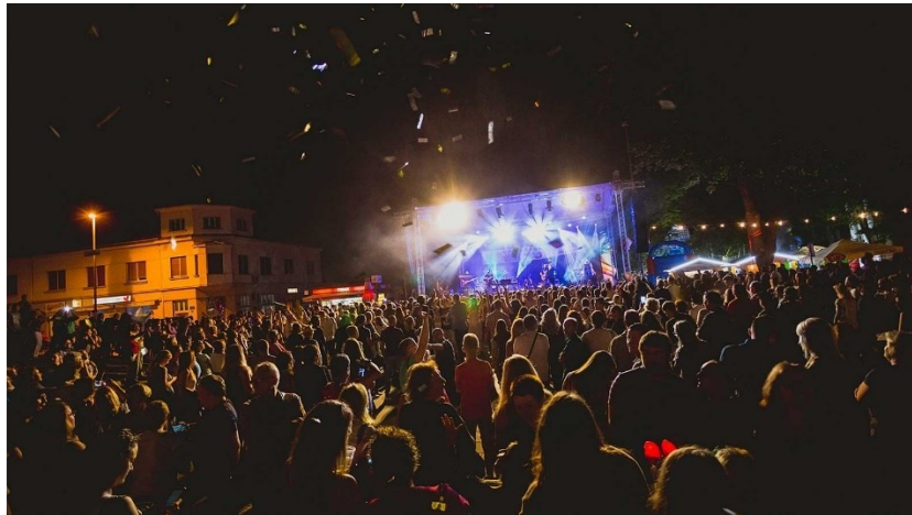
Slika 14. Manifestacija Rokovo – glazbeni koncert