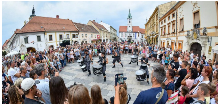
Slika 5. Špancirfest