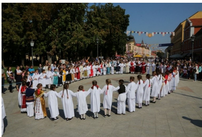
Slika 11. Vinkovačke jeseni