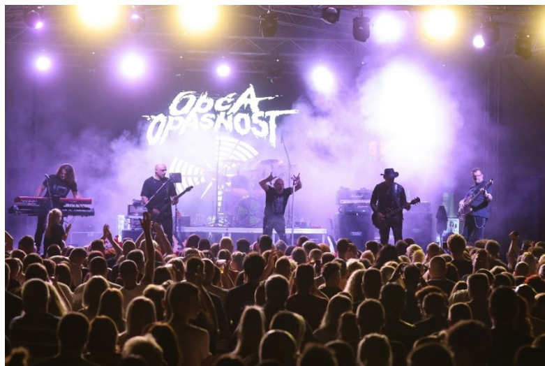
Slika 7. Picokijada