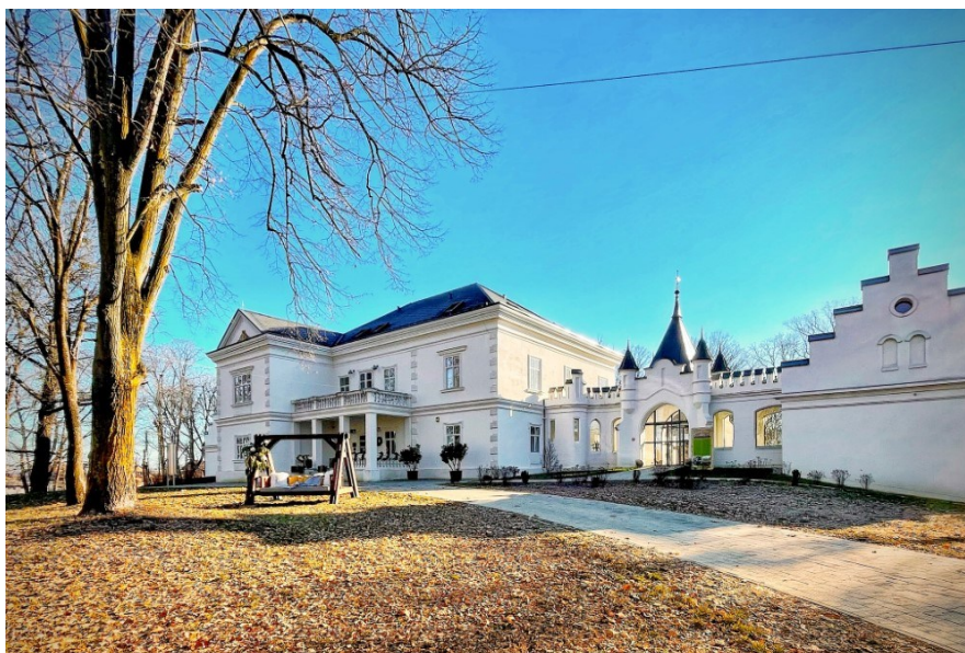
Slika 16. Dvorac Janković u Suhopolju