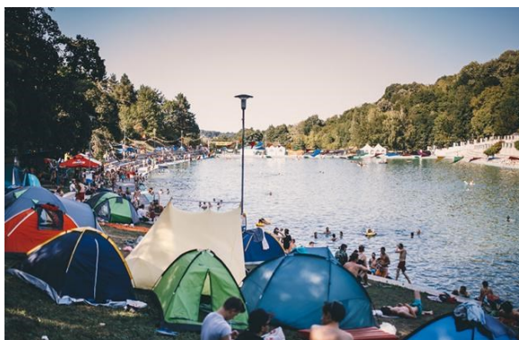
Slika 13. Ferragosto Jam