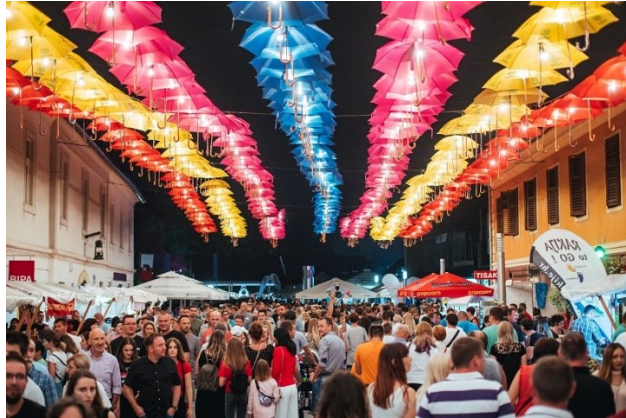
Slika 6. Porcijunkulovo