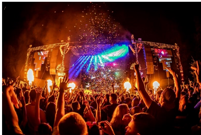
Slika 8. Forestland festival