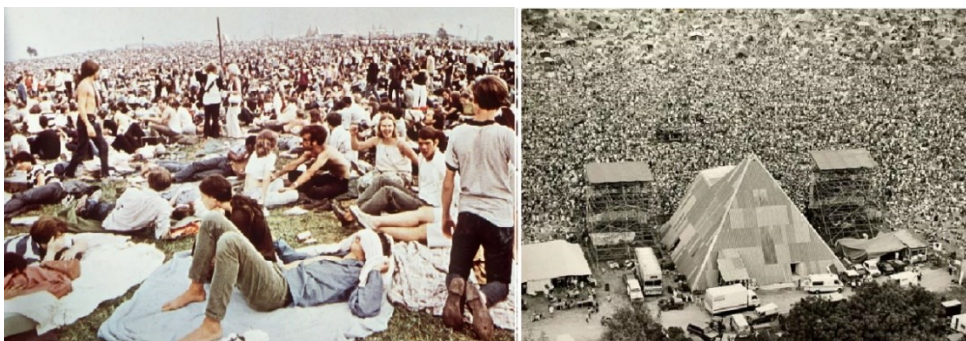
Slika 1. Početci festivala Woodstock (lijevo) i festivala Glastonbury (desno)