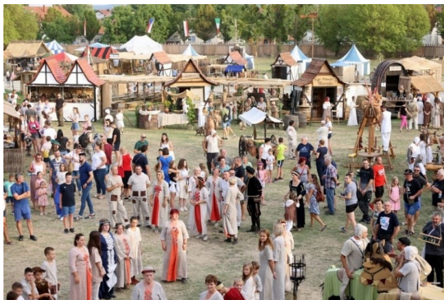
Slika 12. Renesansni festival