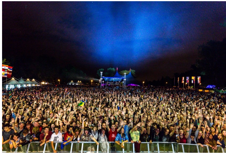
Slika 4. INmusic festival