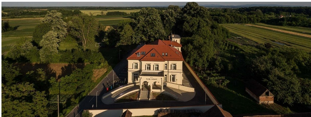
Slika 15. Heritage hotel Kurija Janković