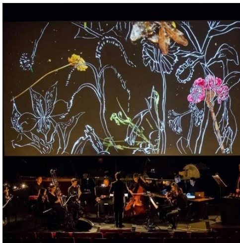
Slika 10. Muzički biennale Zagreb