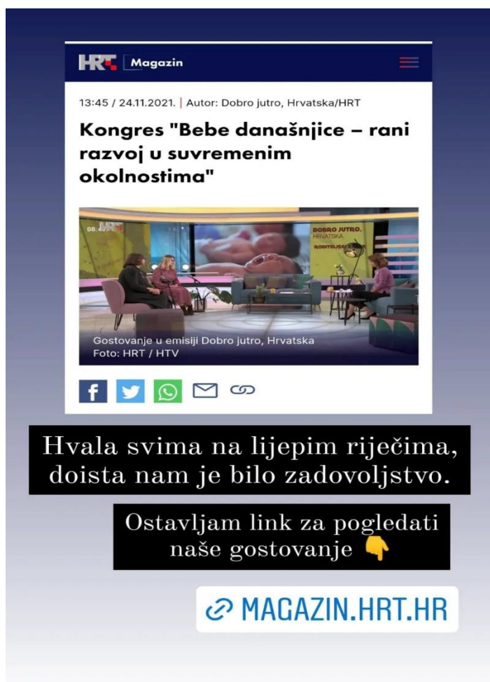
Slika 5. Sudjelovanje u HRT emisiji „Dobro jutro Hrvatska“