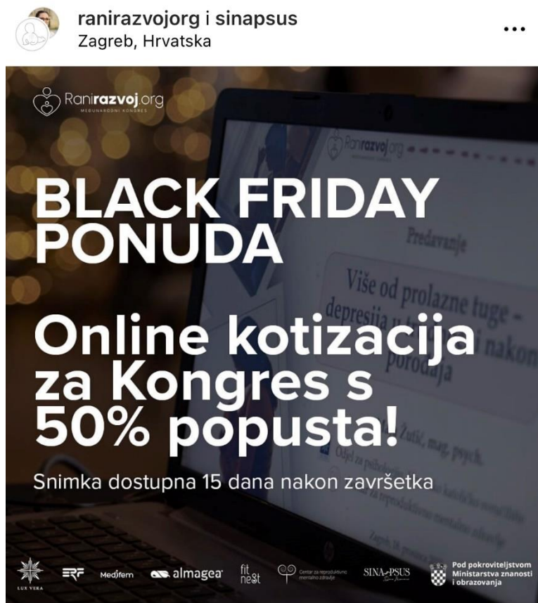
Slika 2. Kotizacija za online sudjelovanje – sniženje povodom black fridaya kao sredstvo privlačenja kupaca