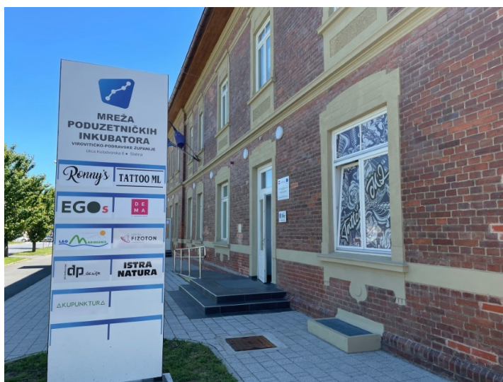
Slika 3. Poduzetnički inkubator u Slatini